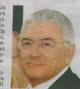
Il manager Giustino Varrassi

TERAMO. «L'avvio di un importante fase nell'opera generale di rilancio dei servizi sanitari dell'azienda». Così in una nota diffusa ieri la direzione generale della Asl, guidata da Giustino Varrassi, ha definito la nomina dei nuovi responsabili dei dipartimenti dell'azienda sanitaria teramana. Si tratta dei 9 nuovi "super-primari" - durante l'era Molinari erano 14 - chiamati a guidare le strutture che racchiudono i reparti della stessa area nei quattro ospedali. Tra i loro compiti quello di negoziare e assegnare i budget ai diversi servizi e reparti e decidere sull'utilizzo del personale. I nuovi direttori sono Riccardo Lucantoni per il polo